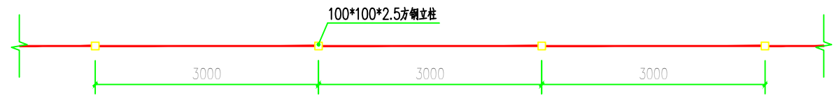
浸塑金属网围墙标准段平面图 1:50